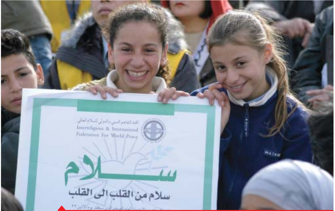
Giovanissimi vengono premiati in una manifestazione in Medio Oriente

La Federazione per la Pace Universale è un'alleanza di individui e organizzazioni dedicati a costruire un mondo di pace in cui tutti gli uomini possono vivere in libertà, armonia, cooperazione e prosperità