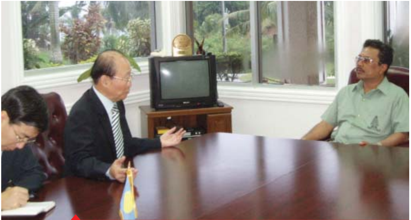
Il Presidente di Palau (a destra) incontra i rappresentanti dell'UPF-IIFWP

Sintesi del discorso dell'On. Tommy E. Remengesau Jr. (Presidente della Repubblica di Palau)