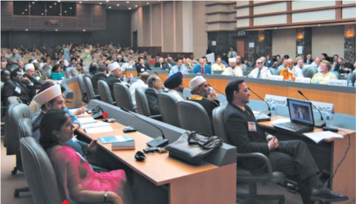
Conferenza interreligiosa presso le NU a NYC

“Le Nazioni Unite furono create non per condurre l’uomo nel paradiso ma per salvarlo dall’inferno” (Dag Hammarskjold, secondo segretario generale delle N.U.)