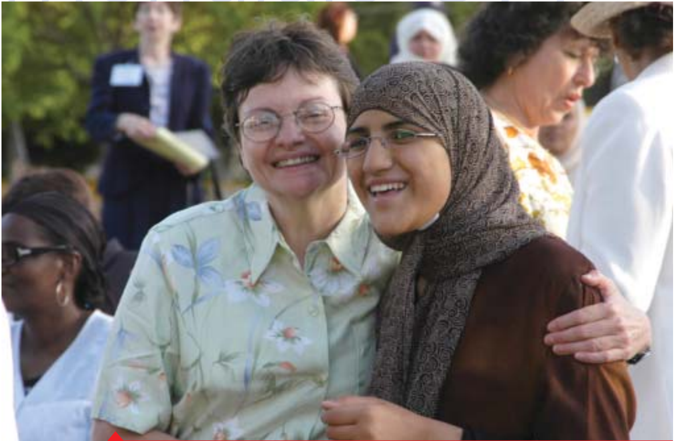
Delegate femminili al Congresso Mondiale di Seul

Settanta donne da 37 paesi si sono riunite a Seul dal 28 al 31 marzo 2006 per il primo Summit Mondiale UPF-IIFWP delle donne per la pace