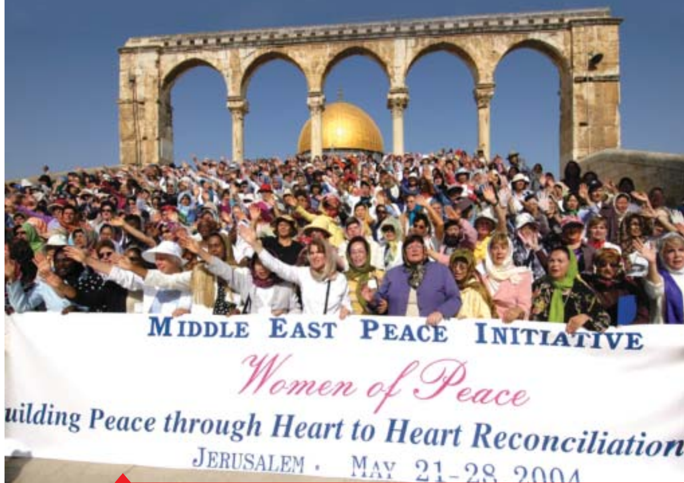
Manifestazione delle Donne di Pace a Gerusalemme

Da alcuni anni la UPF-IIFWP organizza un pellegrinaggio di pace in Israele e Palestina chiamato “Middle East Peace Initiative” e conosciuto come MEPI