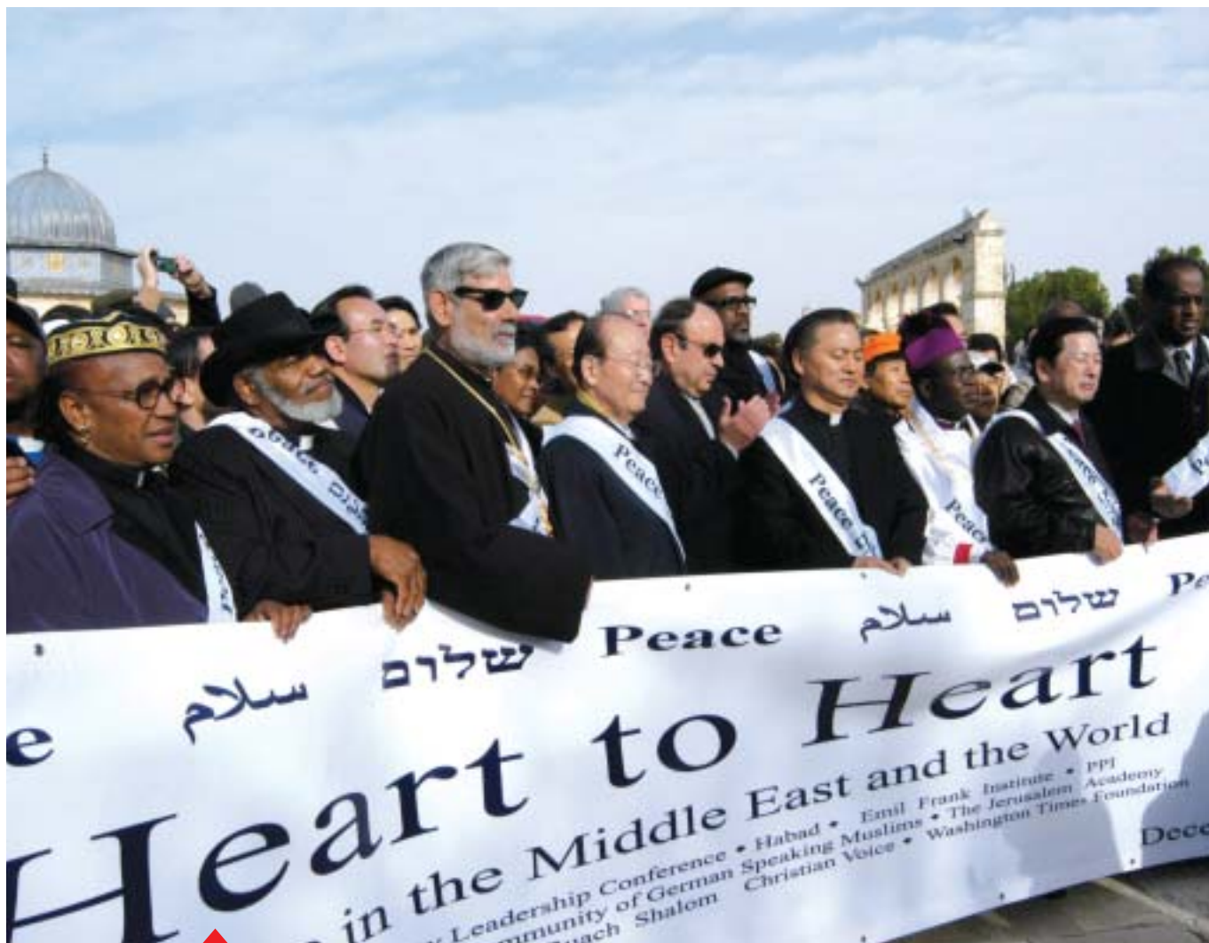
Manifestazione “da cuore a cuore” a Gerusalemme

Il Fondatore della UPF-IIFWP ha realizzato dal 12 settembre al 23 dicembre un tour di 100 città in 67 nazioni, molte delle quali in Europa, nel corso del quale ha portato ad un vasto pubblico il proprio messaggio di pace e di riconciliazione.